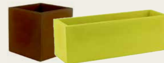
Col·lecció Fang de Vondom Cub 50x50 cm 85 € Jardineria 40x100x40 cm 135 €