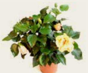
Hibiscus en torreta de 14 cm 4,75 €

* En cas de fi d'existències, consulteu a l'establiment propera disponibilitat.