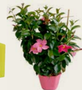
Dipladenia en torreta de 17 cm 9,95 €