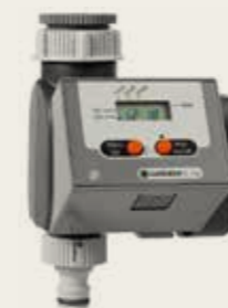
Programador Gardena C14 29,99 €

*Preus vàlids del 15/5/2015 al 12/7/2015, ambdós inclosos.